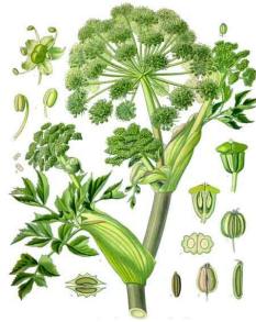
A. archangelica da Koehler's Medicinal-Plants (1887)